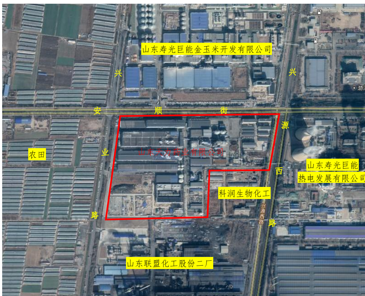
图1 厂区周边环境情况